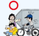
・団体活動への往復中、自転車で通行人とぶつかりケガをさせた場合