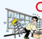
・団体活動中に、一時的に借用した体育施設の窓ガラスを割ってしまった場合

また、AW区分にご加入の場合には、上記に加えて、「団体活動中及びその往復中」以外に発生した賠償事故も対象となります。