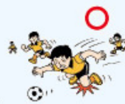
・団体活動中のケガ

また、AW区分にご加入の場合は、上記に加えて、「団体活動中及びその往復中」以外の事故(日射・熱射病、細菌性・ウイルス性食中毒及び突然死を除く。)も対象となります。