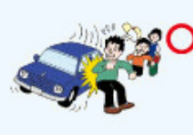
・団体活動への往復中のケガ